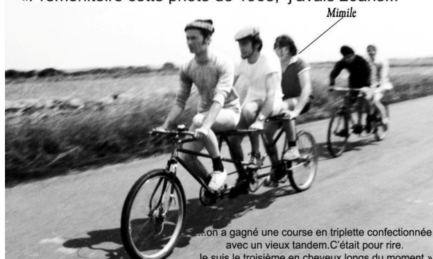
...on a gagné une course en triplète confectionnée avec un vieux tandem. C'était pour rire. Je suis le troisième en cheveux longs du moment.»